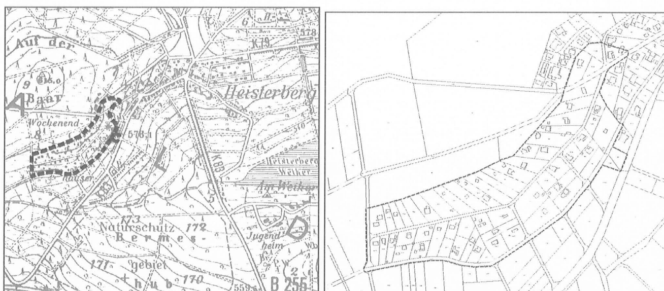
Räumliche Lage des Geltungsbereichs des gesamten Bebauungsplans, unmaßstäblich.

Das Wochenendhausgebiet schließt sich südwestlich der Ortslage von Heisterberg an und umfasst insgesamt ca. 7,2 ha. Es liegt am Südosthang der Erhebung „Auf der Baar“ (616 m ü. NN) auf einer Höhe zwischen 585 m ü. NN und 605 m ü. NN. Im Außenbereich schließt sich nordwestlich eine Waldfläche an, ansonsten landwirtschaftliche Nutzflächen, welche ausschließlich als Grünland genutzt werden.