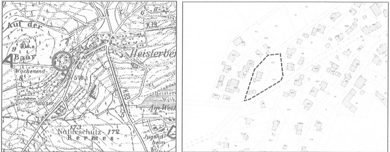
Räumliche Lage des Geltungsbereichs der 3. Änderung des Bebauungsplans, unmaßstäblich.

Der Geltungsbereich der Planänderung liegt mittlerweile innerhalb der Ortslage und hat keine gemeinsame Grenze mit dem Aussenbereich. Die Ortslage ist hier überwiegend dem unbeplanten Innenbereich gemäß § 34 BauGB zuzuordnen. Die westlich angrenzenden Bauflächen besitzen den Gebietscharakter eines „Allgemeinen Wohngebiets“ gemäß § 4 BauNVO, die nördlich und östlich angrenzenden Bauflächen die eines „Mischgebiets“ gemäß § 6 BauNVO. Das unmittelbar östlich angrenzende Grundstück ist im Bebauungsplan „Unter dem Heeg“ bereits als solches festgesetzt.